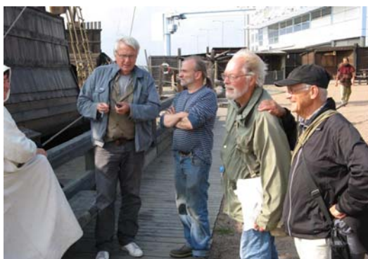
Bokens omfattande historiska del krävde mycket förarbete. Författarna gjorde studieresor till bland annat Falsterbonäset, Foteviken och Malmö den 21 augusti 2008 assisterade av John Nygren till höger.