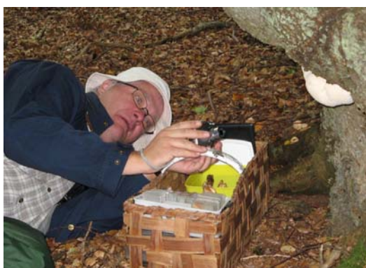
Sigvard fotograferade igelkottaggsvampen, som är avbildad i boken på sidan 142. I Meddelande 67/2007 skriver han om en svampexkursion han ledde på Väderön två år tidigare då svampen hittades. Foto Magnus Andrell, 21 sept. 2008.