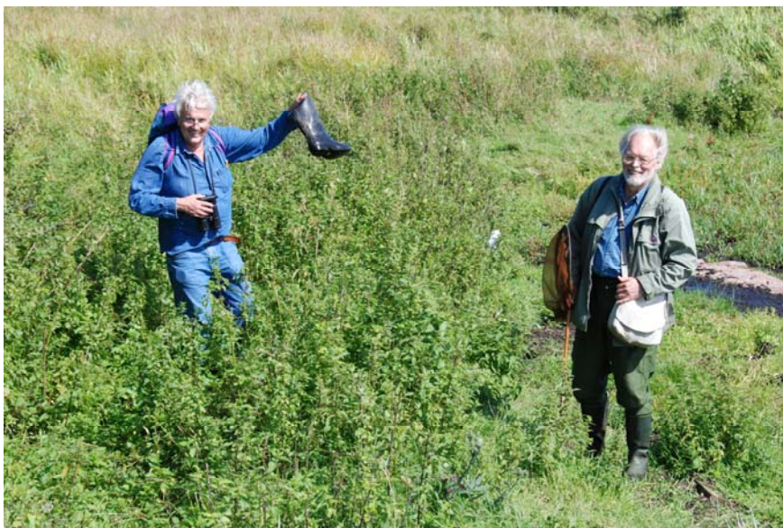
Två glada gossar fältarbetade på Hallands Väderö den 31 juli 2007 och.