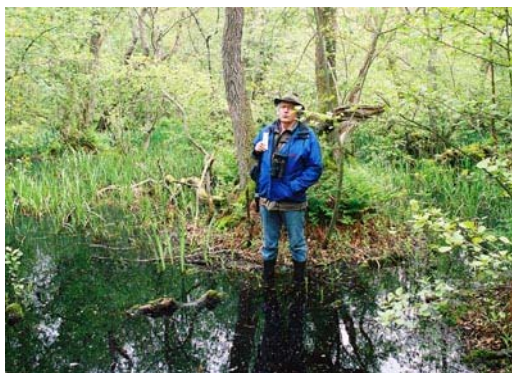
Urban såg med oro på invasionen av jättegörö i Ulagapskärret vid projektets inledning den 13 juni 2006. Jämför med bilden på sidan 101 i boken.

Med "Sällskapet" avses Sällskapet Hallands Väderös Natur (SHVN) bildat 1942. Det utger en numrerad skriftserie: "Meddelande från SHVN".