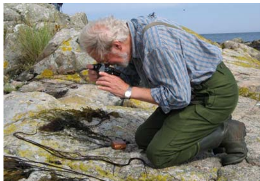
Nils fotograferade alger till bildförlagor. Bilderna finns i boken på sidan 195.