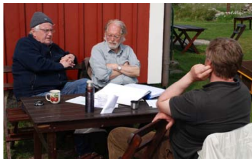
Paus vid Fyrplatsen. Författarna överlade med Magnus under duons sista hela arbetsvecka på Väderön. Foto John Henrysson, 20 maj 2010.