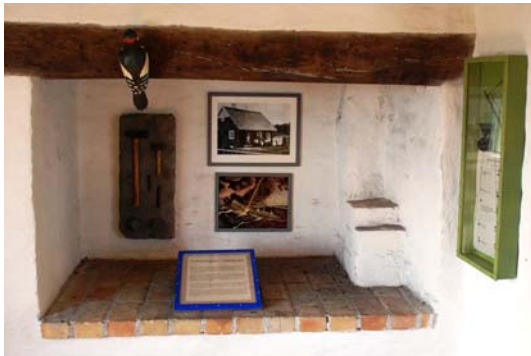
Den öppna spisen i förstugan har blivit monter.