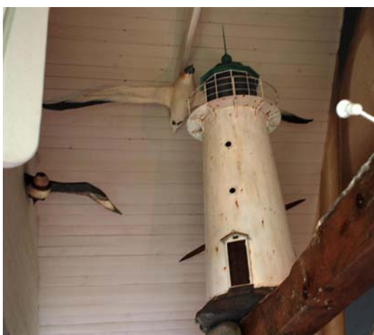
Tittar man in på Väderö museet kan man se en modell av Hallands Väderö fyr omgiven av havsfåglar.