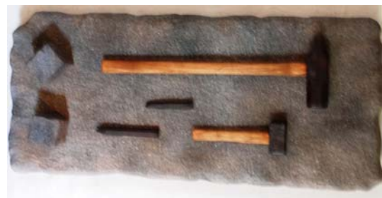
Äldre handredskap för stenhugning visas i öppna spisen och redskap från skogsavverkning på en vägg.