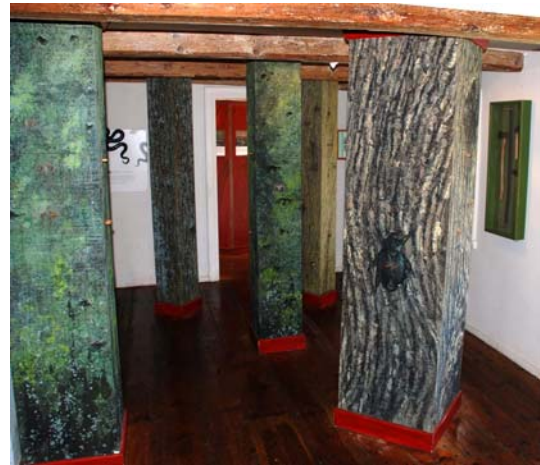
Pelarna i pelarsalen har luckor som kan öppnas. Bakom dem finns bilder från olika platser på ön. Bilderna lyses upp inifrån av energisnåla lampor när luckan öppnas. Batterier, som driver lamporna, laddas med solceller utanför stugan.