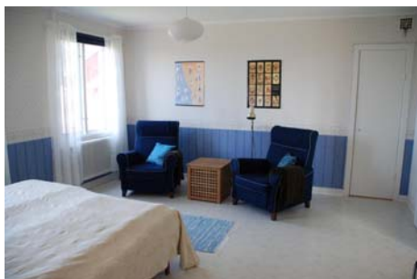
Bild 5. Interiör från Sunnan.