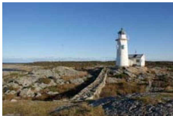
Bild 10. Foto taget från Bagganäsan 2009. På stenmuren gick stigen till det rivna ångpannehuset. Till höger skymtar sötvattenreservoaren (inhägnad). Två dubbeltyfoner har ersatt den tidigare. Vaktstugan är utan skorsten och har ny fönster.