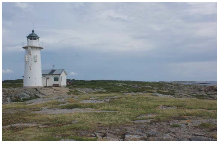
Bild 1 Fyren fotograferad från platsen för det rivna ångpannehuset med vy mot söder längs ön västsida.

Efter att fem fartyg förlit vid ön under en storm i maj 1882 beslöt Lotsverket, som gick upp i Sjöfartsverket 1956, att uppföra en fyr där. 1884 anlades fyrplatsen. Det 13 meter höga, vitmålade, runda fyrtornet uppfördes i järn direkt på klipporna ute på Bagganäsan, på öns nordvästra del.