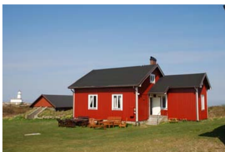
Bild 4. I nuvarande Västan bodde som regel fyrmästarfamiljen.