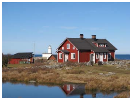
Bild 3. Ett foto från samma plats mer än hundra år senare. I stora huset med lägenheterna Sunnan, Östan m.fl. bodde fyrvaktarfamiljerna. Kupa på taket och farstukvistar har tillkommit och fönster flyttats.