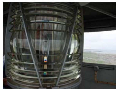
Bild 7. Linsen i fyrtornet

Ägare: Sjöfartsverket äger fyr och maskinhus.