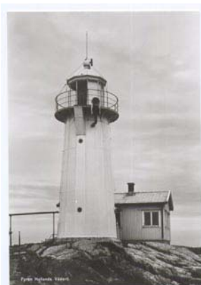
Bild 9. Nyare vykort. Fyren har fått ett till byggt maskinhus med vaktrum och tyfon på tornet.