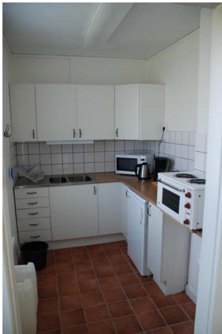
Bild 6. Pentryt i bryggghuset (tvättstugan), som är det senaste tillskottet bland lägenheterna.