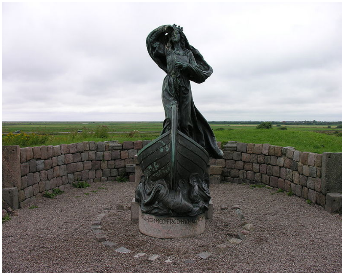
Statyn över drottning Dagmar på vällen av den forna borgen Ribershus i Ribe