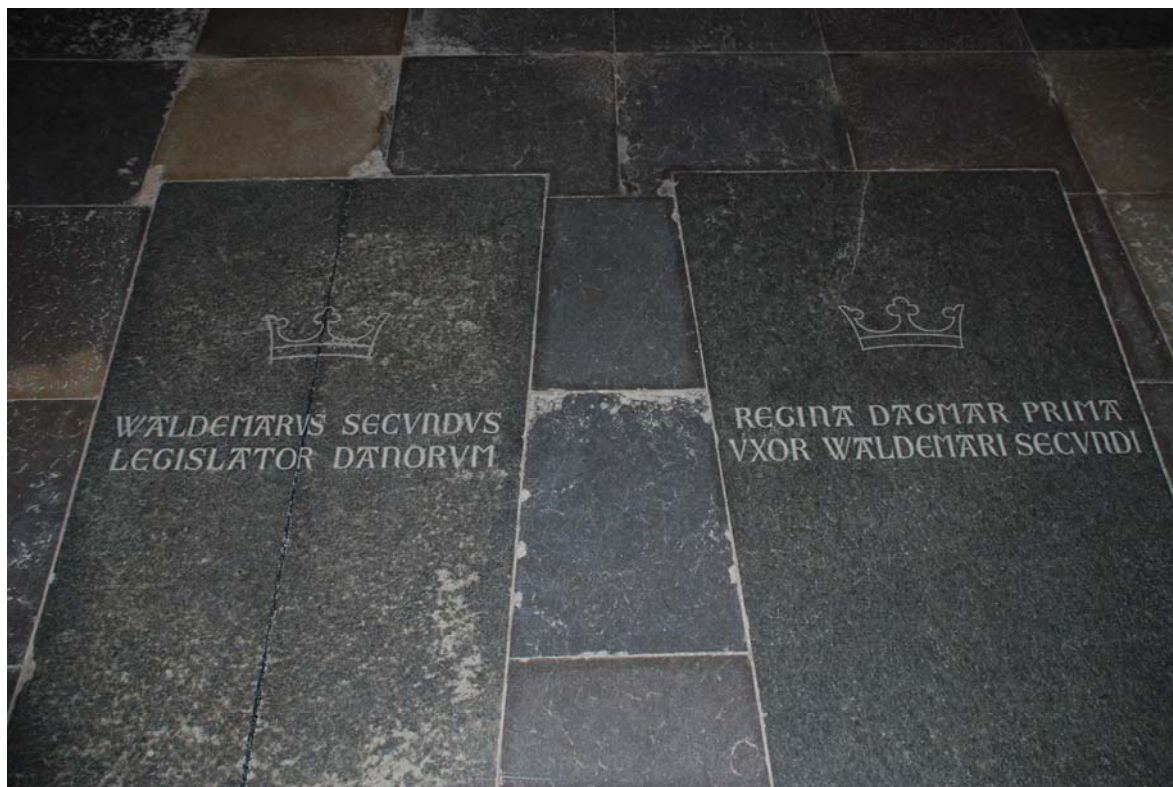
Minnesstenar över Valdemar II, Danmarks konung och drottning Dagmar, hans äkta hustru.