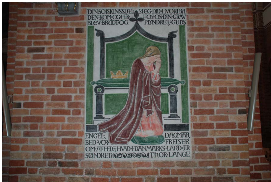
Fresk (kalkmålning, 1919) med drottning Dagmar. Texten i fri översättning: "Din solskenssjäl steg dit varifrån den kom och här hos oss blev din grav uppbruten och plundrad. Guds ängel, Dagmar, bed vår frälsare om att hela det som i Danmarks land är söndertaget. Thor Lange." Vykort med Dagmarkorset, minnestavlan och målningen kan köpas i kyrkan.