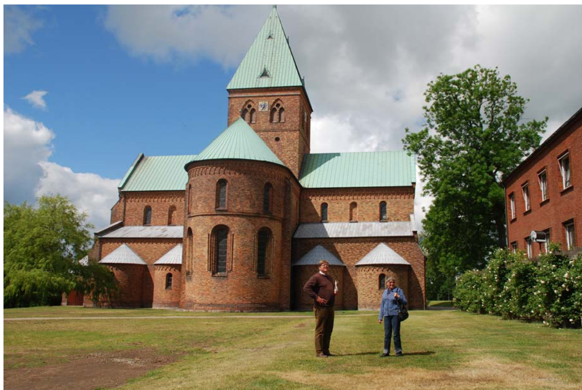
Sct Bendts Kirke från torget i Ringsted.