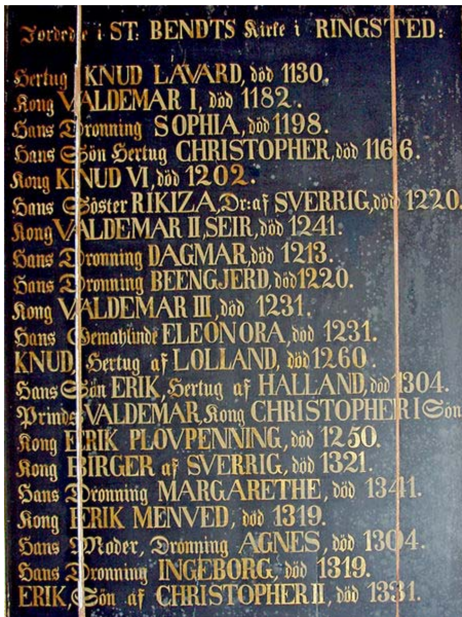
Sankt Bendts Kirke var fram till mitten av 1300-talet den främsta gravkyrkan för medlemmar av det danska kungahuset.

År 1219 drog Valdemar Sejr med ledungsflottan på korståg till Estland, ditkallad som hjälp av Albert av Riga, som själv försökte erövra Estland. Det är i korståget mot esterna som Dannebrogen, enligt en senare nedtecknad legend, föll ner från himlen i slaget vid Lindanäs. Valdemar segrade i Estland med sin armé, och erövrade landet i Alberts ställe.