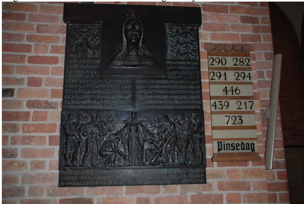
Minnestavla på tjeckiska och danska över drottning Dagmar.

Några bilder från Sct Bendts Kirke i Ringsted 3 juni 2009.