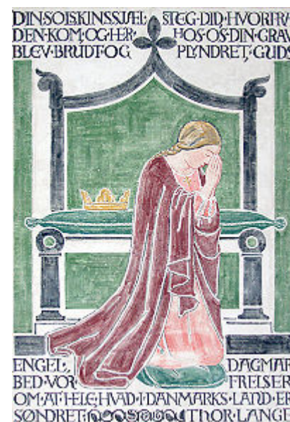
En minnestavla över drottning Dagmar i Sankt Bendts Kirke i Ringsted

http://sv.wikipedia.org/wiki/Sankt_Bendts_Kirke .