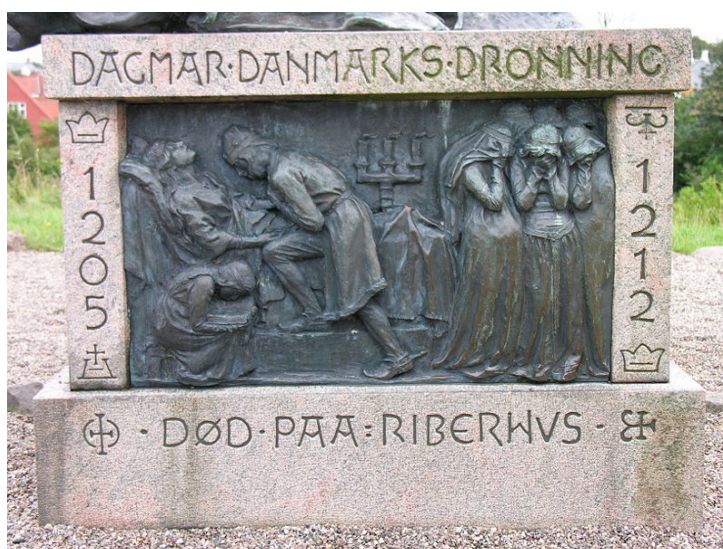
Sockeln till statyn av Dagmar vid Riberhus på Jylland.

I den andra kretsen ingår visorna: "Dronning Dagmar och Junker Strange", "Dronning Dagmars Bryllup", "Dronning Dagmars död" och "Dronning Bengerd".